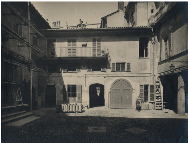
5. Casa degli Atellani, il secondo cortile prima e dopo l'intervento di Portaluppi.