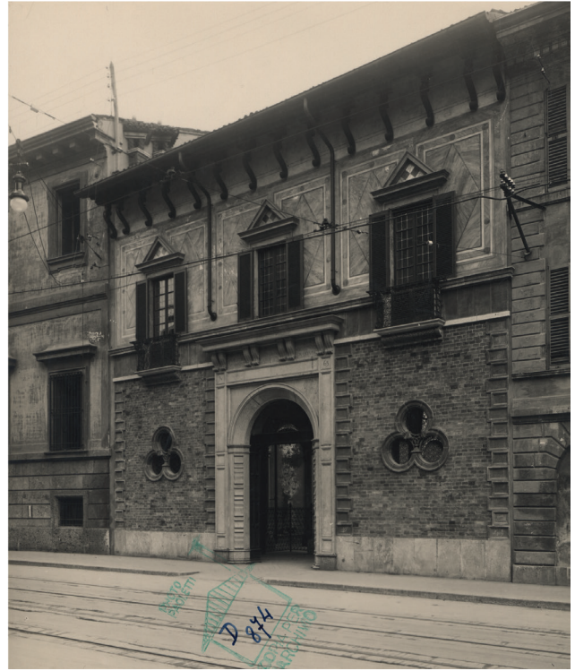
4. Casa degli Atellani, la facciata al civico 65 di corso Magenta prima e dopo l'intervento di Portaluppi.