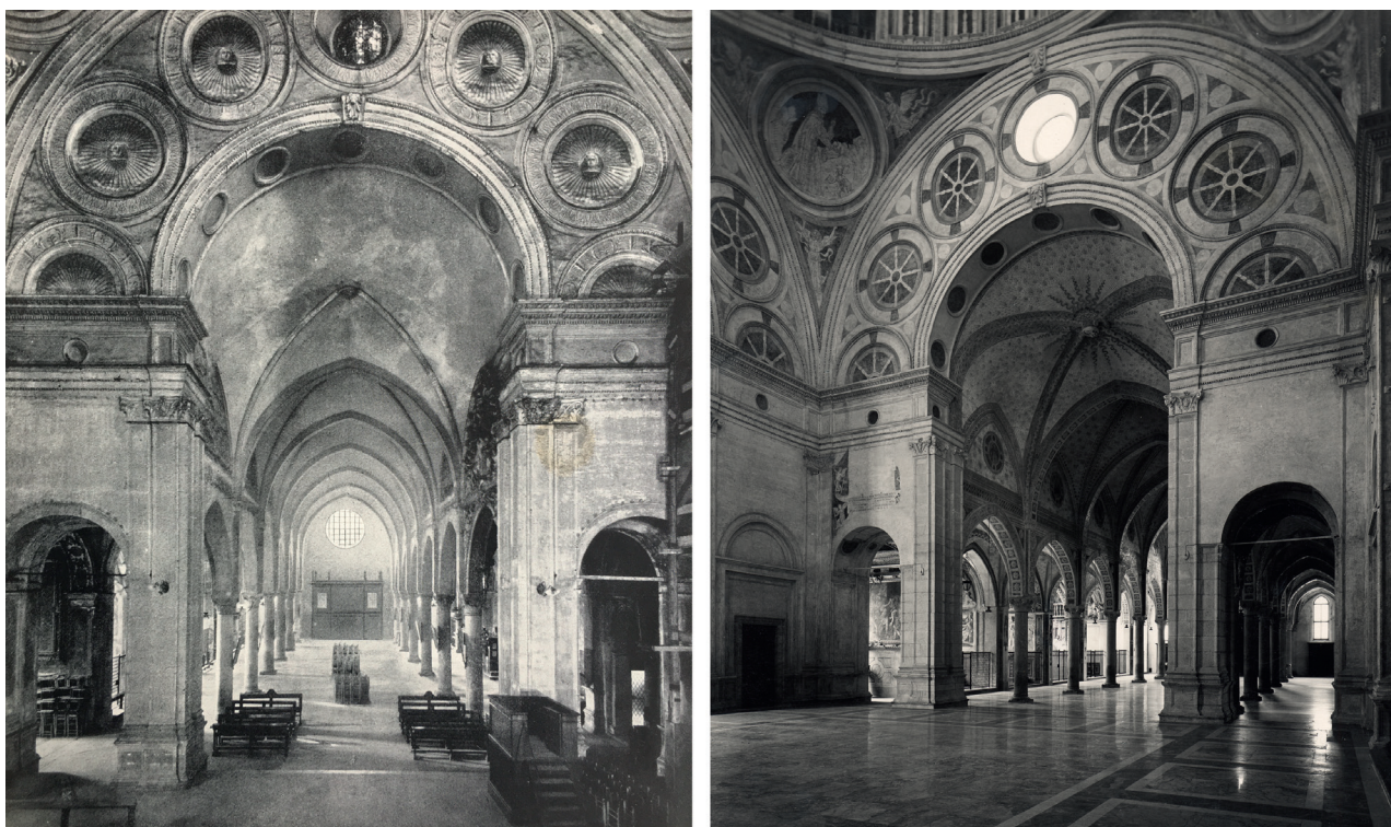
7. La chiesa di Santa Maria delle Grazie prima e dopo l'intervento di Portaluppi. Immagine da Agnoldomenico Pica, Piero Portaluppi, Le Grazie , Roma, Casa Editrice Mediterranea, 1938, e fotografia di Antonio Paoletti, Milano, Fondazione Piero Portaluppi