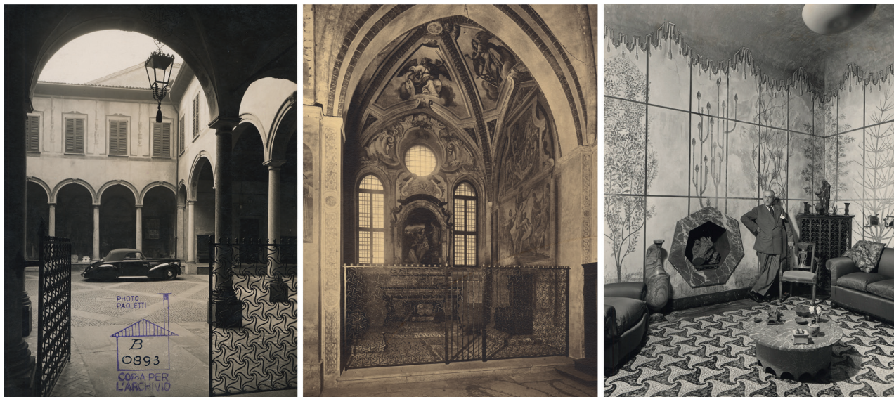
6. Il motivo Atellano a triangolature serpeggianti. Da sinistra: la cancellata di Casa degli Atellani, fotografia di Antonio Paoletti; la cancellata della cappella degli Atellani, fotografia di Antonio Paoletti; la sala verde dell'appartamento Portaluppi, foto Farabola, Milano, Fondazione Piero Portaluppi