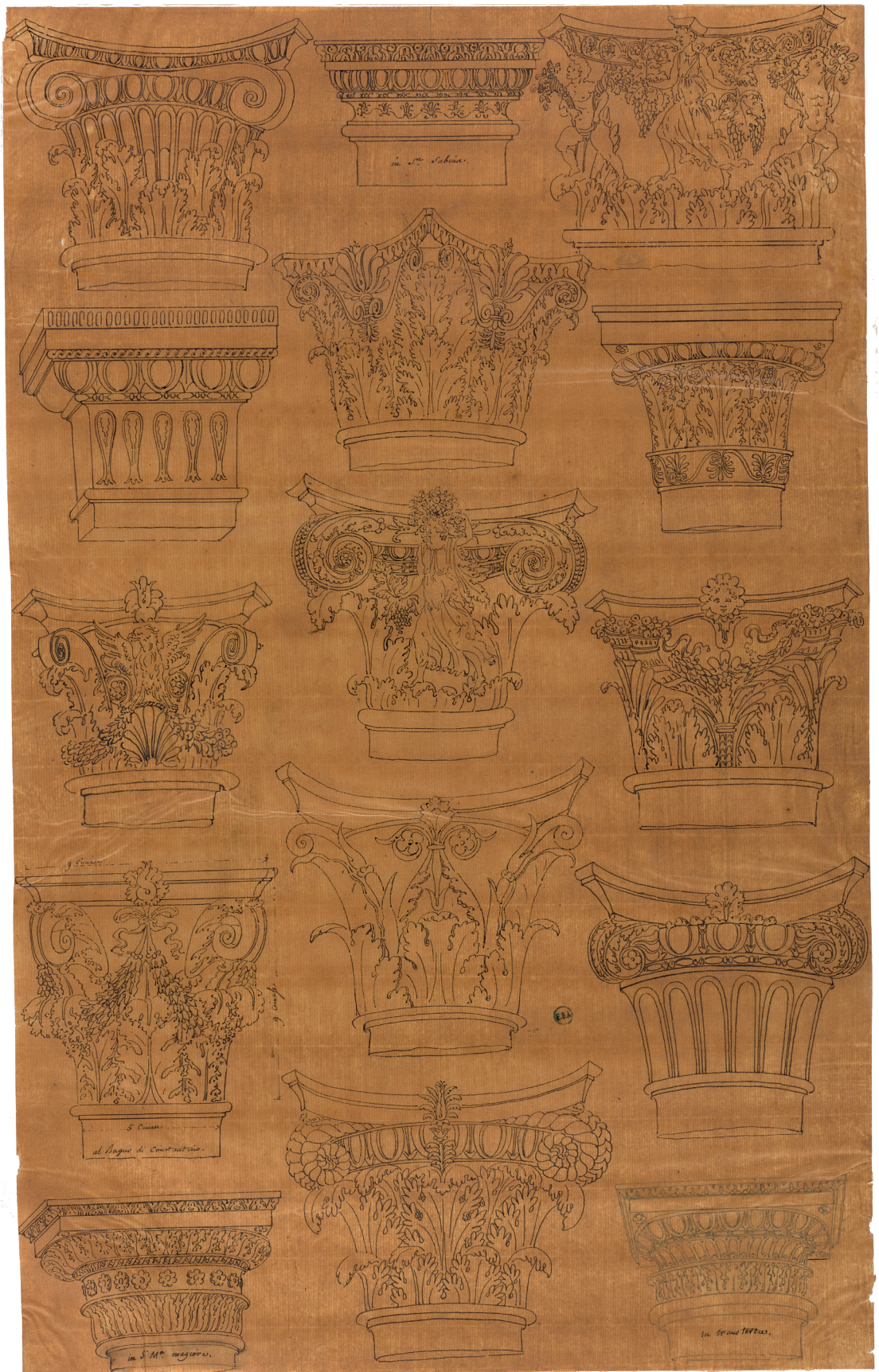
1. Léon Dufourny, Calchi su carta traslucida di disegni di capitelli di Giuliano da Sangallo (Biblioteca Apostolica Vaticana, ms. Barb. lat. 4424), Parigi, Collections de l'École nationale supérieure des Beaux-Arts, PC 22230, f. n.n.