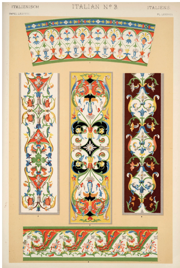
4. Owen Jones, Italian ornament , in The Grammar of Ornament , London, Quaritch, 1910, tav. 3