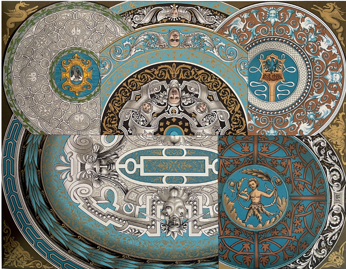
1. Alfredo Melani, Vari tipi di faentini , Arte del Rinascimento , in L'Ornamento policromo , Milano, Hoepli, 1886, tav. 38