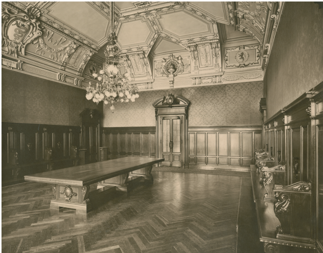
9. Vincenzo Aragozzini, Foto della Sala dell'Orologio a Palazzo Marino , 1927, gelatina ai sali d'argento su carta, Milano, Civico Archivio Fotografico, inv. FM PM 44