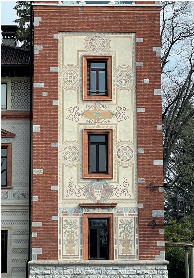
5. Particolare della torre di Villa de Strens, Gazzada (VA)