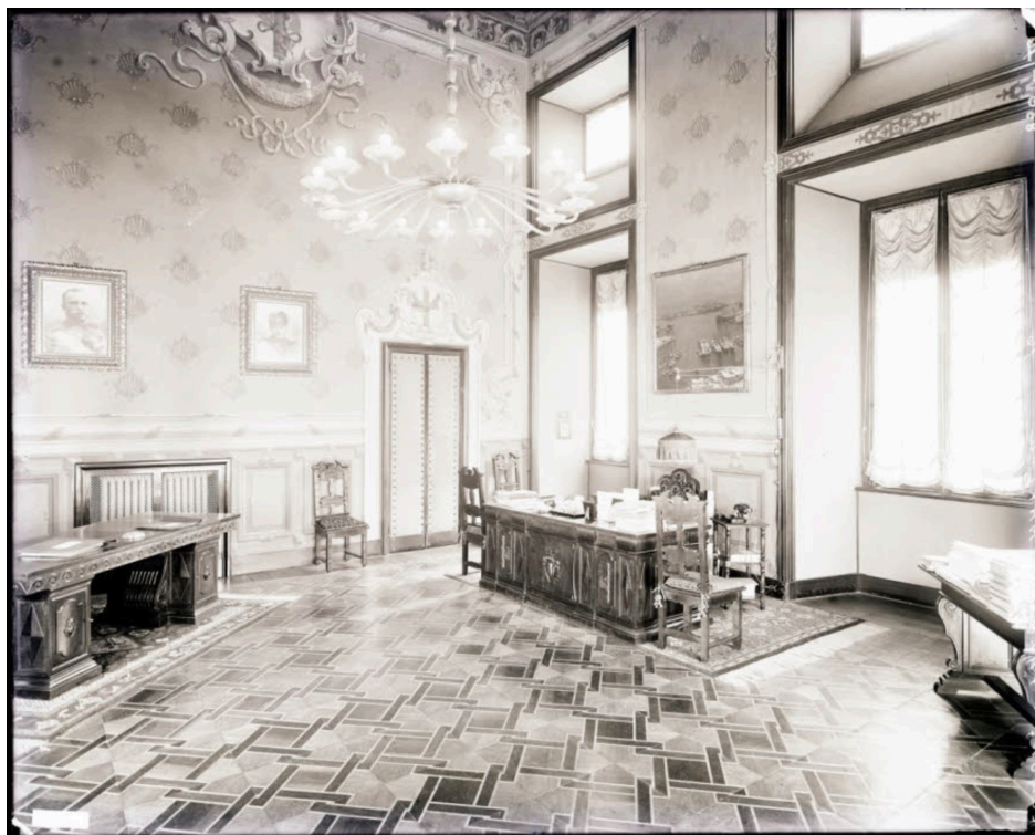
10. Vincenzo Aragozzini, Clichè verre di un interno di Palazzo Marino (attuale ufficio del Vicesindaco) , 1927, gelatina bromuro d'argento su vetro, Milano, Civico Archivio Fotografico, inv. D 718