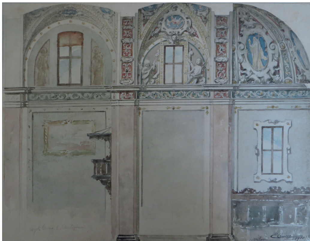
2. Ernesto Rusca, Progetto per la decorazione del coro della chiesa di Barlassina (MB) , 1900, matita e acquerello su carta, Trieste, Allianz spa – B.I.S.A., Fondo Rusca