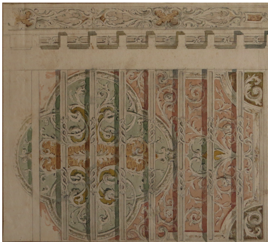
11. Ernesto Rusca, Progetto di decorazione del soffitto della sala da pranzo di Villa Ravizza , 1907 circa, matita e acquerello su carta, Trieste, Allianz spa – B.I.S.A., Fondo Rusca