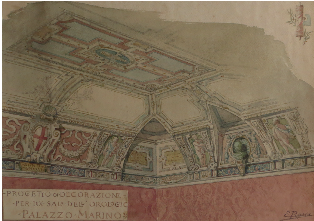
8. Ernesto Rusca, Progetto di decorazione per l'ex Sala dell'Orologio a Palazzo Marino , 1927, acquerello su carta, Trieste, Allianz spa – B.I.S.A., Fondo Rusca