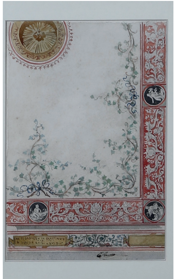
7. Ernesto Rusca, Progetto per le decorazioni esterne del sacello di San Satiro , 1912, matita e acquerello su carta, Milano, Archivio della Soprintendenza Archeologia Belle Arti e Paesaggio per la città metropolitana di Milano