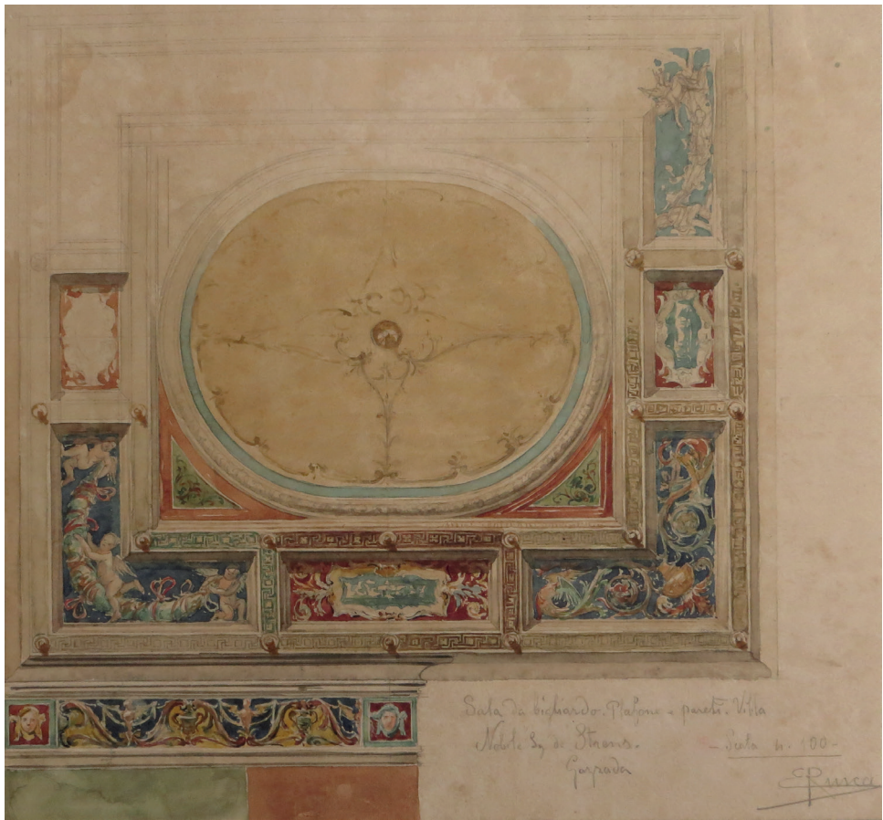
Sala de richardo. Palazzo - pareti. Villa Nobile. S. di Stronno. Capriata Sala n. 100 S. Rusca