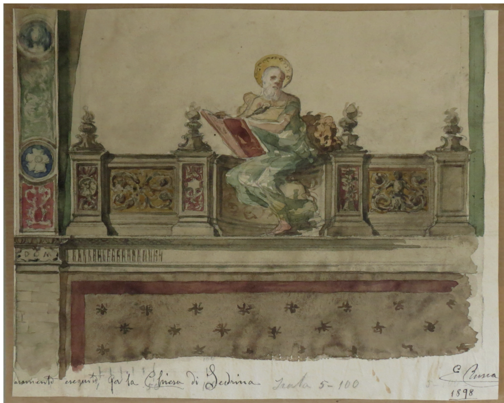
1. Ernesto Rusca, Studio per la decorazione della chiesa di Sedrina (BG) , 1898, matita e acquerello su carta, Trieste, Allianz spa – B.I.S.A., Fondo Rusca