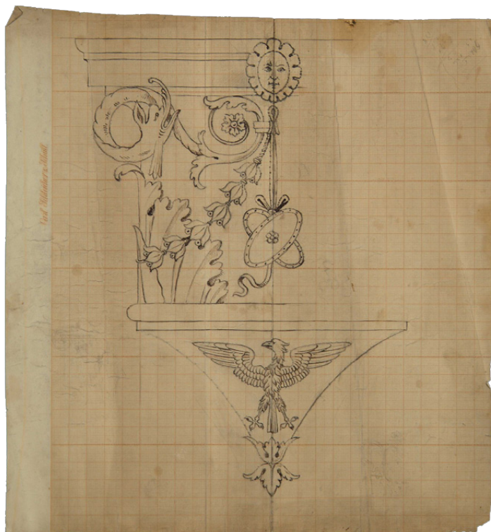
4. Fausto e Giuseppe Bagatti Valsecchi, Disegno di peducio con fiore antropomorfo , fine XIX secolo, matita nera su carta millimetrata, 359 x 293 mm, Milano, Archivio Bagatti Valsecchi, fondo grafico