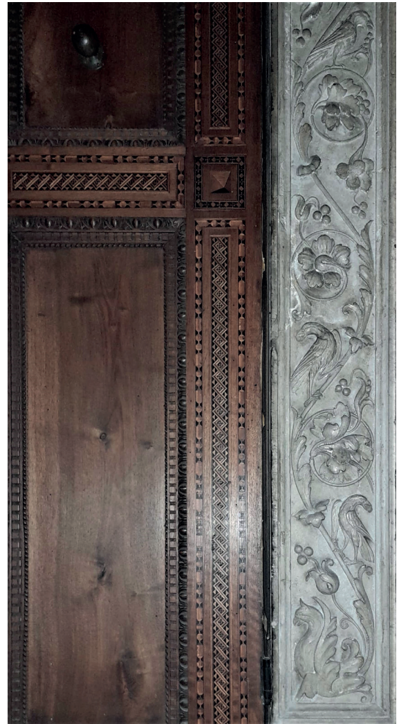
6. Decorazione a girali dello stipite della porta della Camera del Letto Valtellinese , anni Ottanta del XIX secolo, marmo di botticino, Milano, Museo Bagatti Valsecchi