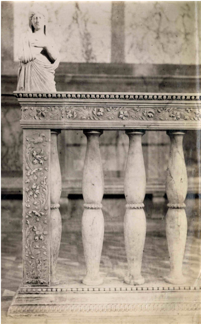
5. Giovanni Battista Brusa, Foto della balastra di Santa Maria dei Miracoli a Venezia , fine XIX secolo, stampa all'albumina, 243 x 189 mm, Milano, Archivio Bagatti Valsecchi, fototeca