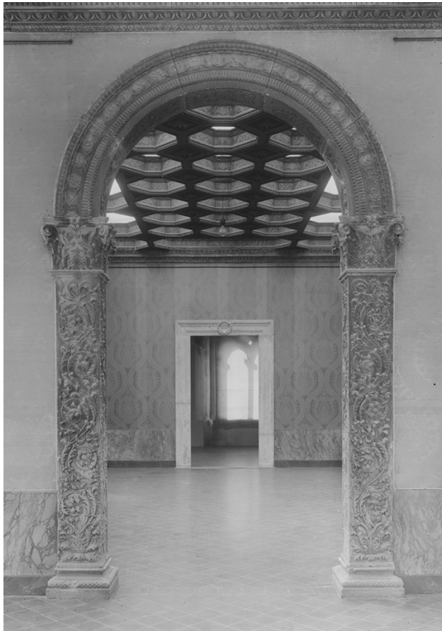
3. Il portale di Palazzo Bonatti nella villa di Torre del Gallo, Firenze, post 1902. Firenze, Archivio Storico Eredità Bardini