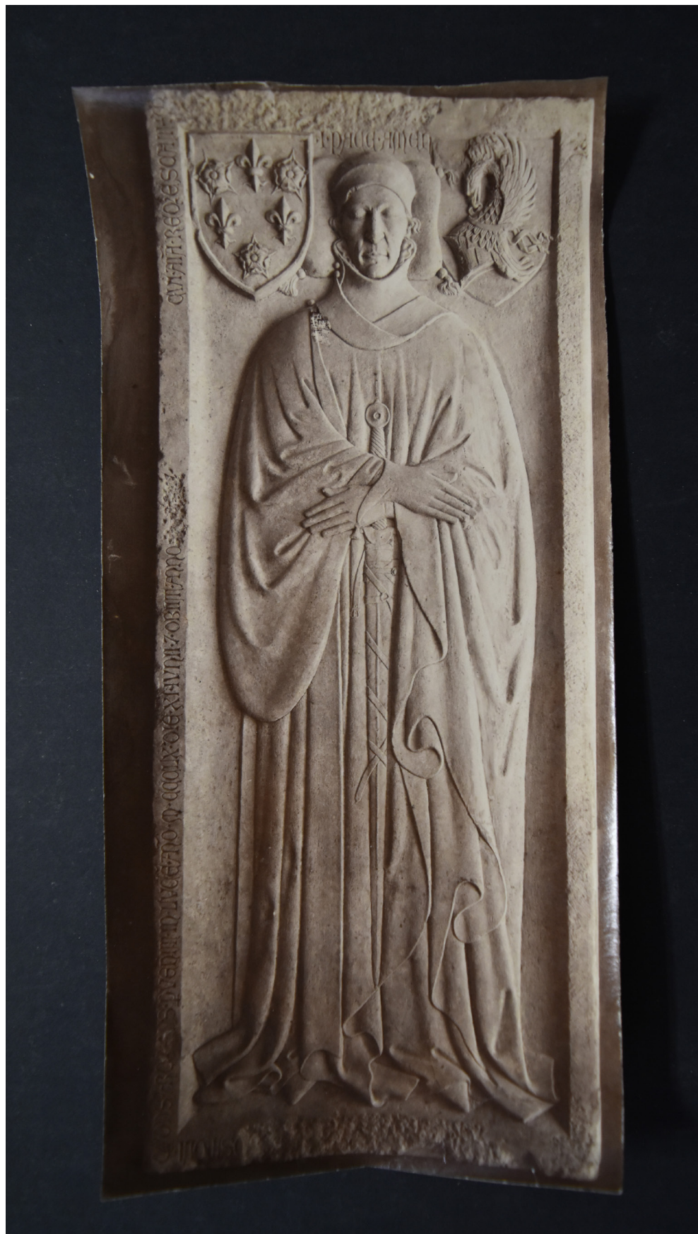
6. Scultore lombardo, Ritratto funebre di Ardengo Folperti , Pavia, Musei Civici del Castello Visconteo. Firenze, Archivio Storico Eredità Bardini