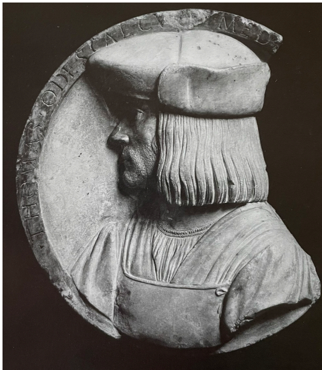
5. Scultore lombardo, Tommaso Odiscalchi, collocazione ignota. Firenze, Archivio Musei Civici Fiorentini, Fondo Stefano Bardini, foto 4447