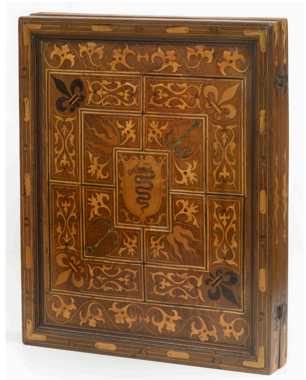
3. Ambito lombardo, Scatola da gioco per scacchi e tric-trac con iscrizione dedicatoria «Bernabos Vicecomes. Comi, 1574» e stemma visconteo , 1574 circa, legno di noce, pero, bosso ebano colorati, Milano, Museo Poldi Pezzoli