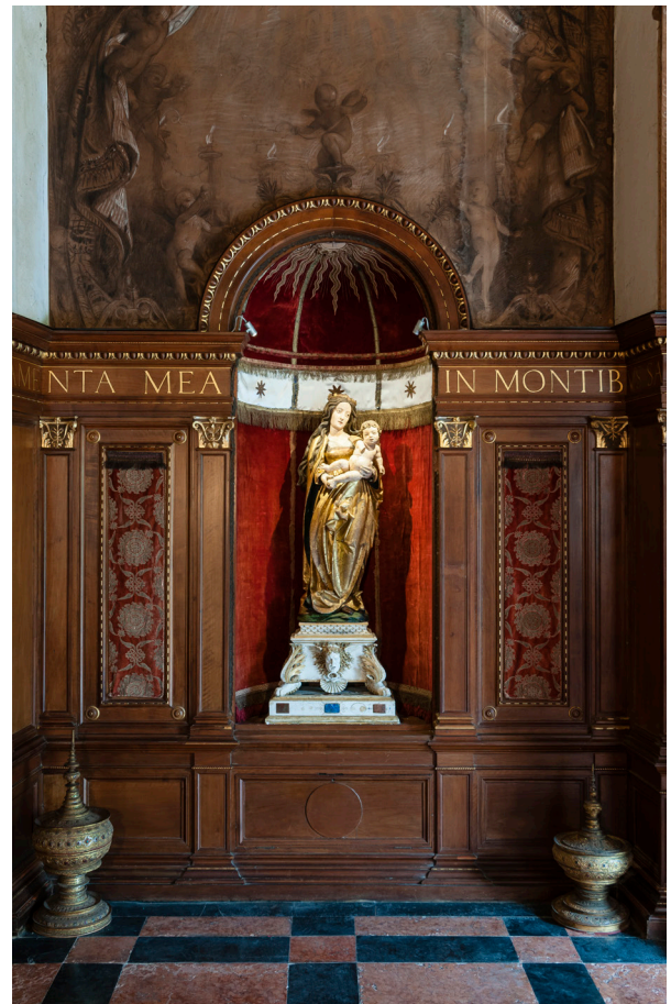
2a. Gregor Erhart, Madonna con il Bambino , Varese, Santa Maria del Monte, Casa-Museo Ludovico Pogliaghi, Sala della Madonna