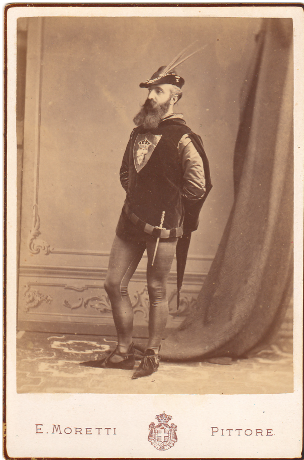
1. Enrico Moretti, Ritratto fotografico del principe Gian Giacomo Trivulzio , fine del XIX secolo, Milano, Stabilimento Fotografico Montabone, Milano, Fondazione Trivulzio