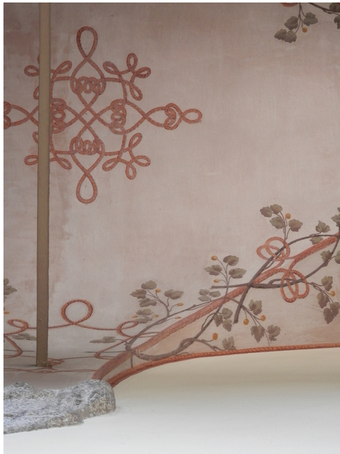
3. Fratelli Turri, Nodi leonardeschi , 1903, Somma Lombardo, castello Visconti di San Vito, già ala Visconti di Modrone