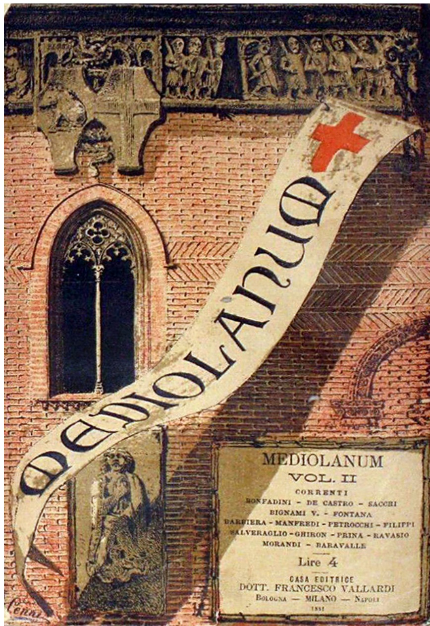
2. Copertina di "Mediolanum", vol. II, Milano, Vallardi, 1881