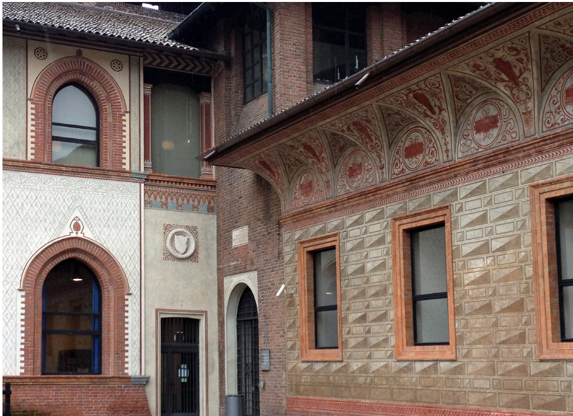
4. Dettagli di superfici e decorazioni nel Castello Sforzesco di Milano