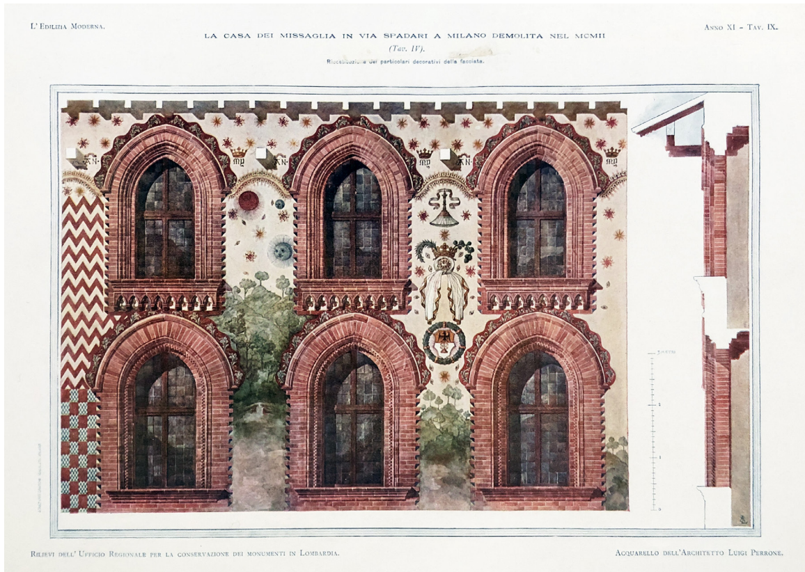
3. La casa dei Missaglia in via Spadari a Milano demolita nel MCMII, "L'Edilizia Moderna", 11, 1902, fasc. 2-3, tav. IX